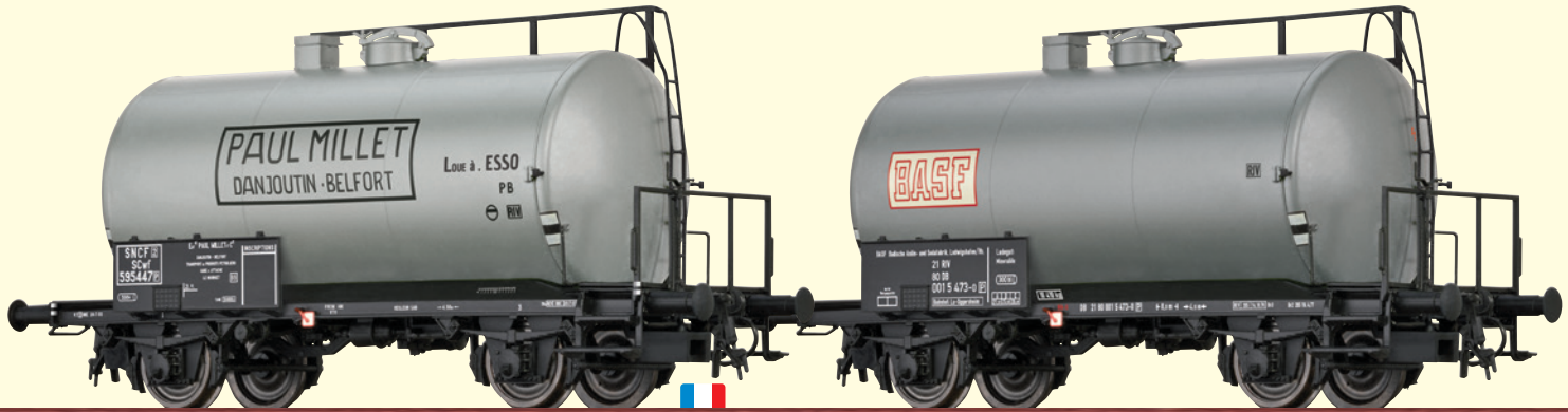
Leichtbaukesselwagen Uerdingen SCwF 2-achsig „Paul Millet“ der SNCF Betriebs-Nr. 595 447 [P]