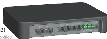
Zentrale Z21 zadní pohled