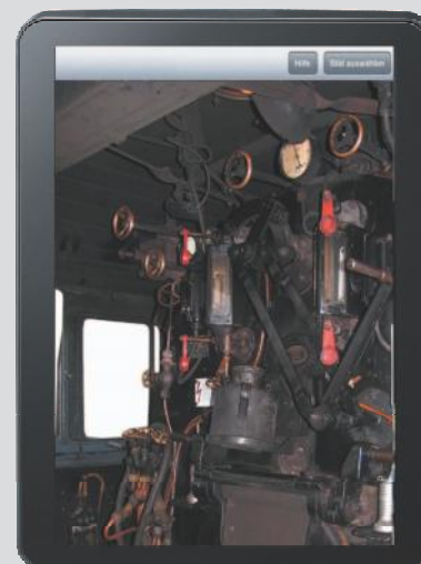
Stanovišt strojvedoucího parní lokomotivy