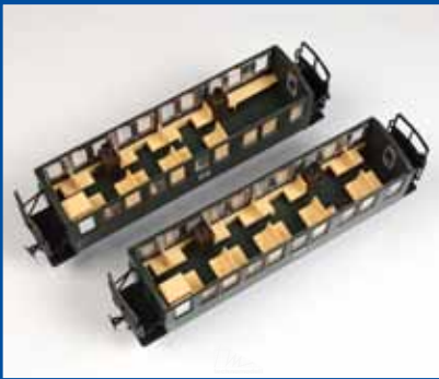
Inneneinrichtung für Oberlichtwagen