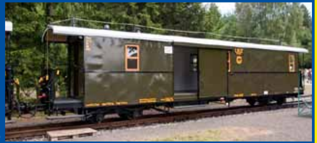
Gepäckwagen DRG-Zug (Epoche II/VI)