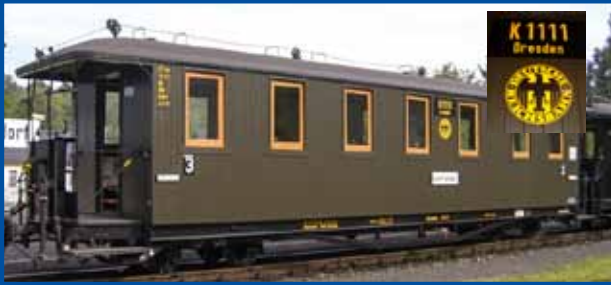
Traglastenwagen DRG-Zug (Epoche II/VI) Best.-Nr. 52421 (H0e)