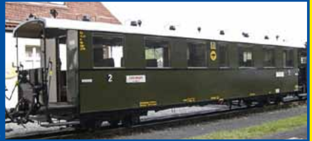
Einheits-Personenwagen DRG-Zug (Epoche II/VI)