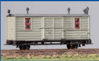
Gepäckwagen der SOEG (Epoche I)