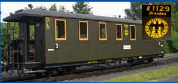
Traglastenwagen DRG-Zug (Epoche II/VI)