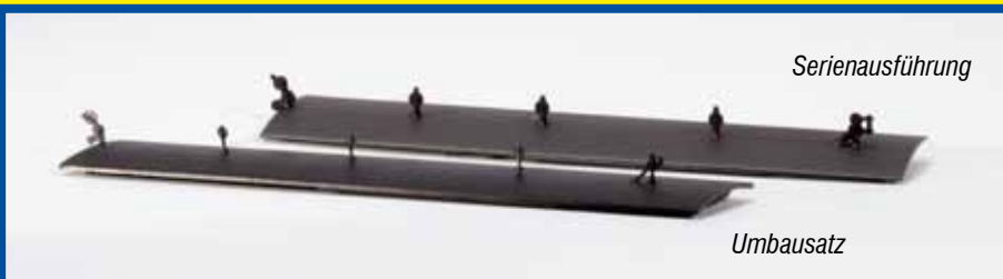
Heberlein-Bremseinrichtung für GG-Wagenbremse