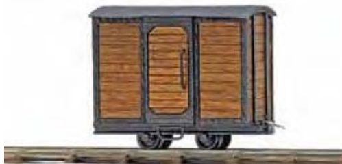
12230 Geschlossener Transportwagen Feldbahnwagen mit braunem Aufbau aus echtem Holz. Mit filigranen Türen und Türgriffen. Länge: ca. 36 mm. Boxcar. Wagon couvert.