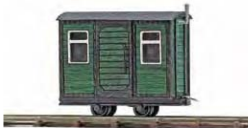
12231 Bauwagen Feldbahnwagen mit grünem Aufbau aus echtem Holz. Als Bauwagen und Aufenthaltswagen einsetzbar. Mit filigranen Türen, Türgriffen, Fenstern, Verglasungen und Schornstein. Länge: ca. 36 mm. Service wagon. Wagon de service.