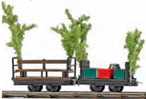
12241 Zwei Wagen »Betriebsausflug« Zwei Feldbahnwagen mit Ausstattung für einen Betriebs- oder Vaterntagsausflug oder sonstige »zünftige« Feste und Feierlichkeiten. Ein Wagen mit Sitzbänken und ein Stirnwandwagen mit Bierfass, Bierkisten und Flaschen. Festliche Dekoration der Wagen mit Bäumchen. Länge je Wagen: ca. 29 mm. Annual company outing. Deux baladeuses.