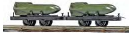
12209 Zwei Wagen mit Bombenladung Auf jedem Wagen befinden sich zwei Fliegerbomben. Länge je Wagen: ca. 29 mm. Two wagons with bombs. Deux wagons chargés de bombes.