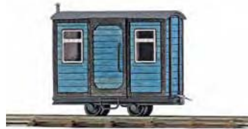
12232 Bauwagen Feldbahnwagen mit blauem Aufbau aus echtem Holz. Als Bauwagen und Aufenthaltswagen einsetzbar. Mit filigranen Türen, Türgriffen, Fenstern, Verglasungen und Schornstein. Länge: ca. 36 mm. Service wagon. Wagon de service.