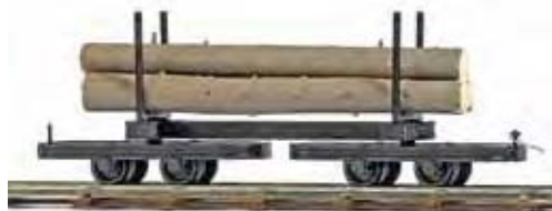
12222 Drehgestell-Rungenwagen mit Baumstämmen Mit drei Baumstämmen als Ladegut. Länge: ca. 60 mm. Three tree trunks on two bogies. Wagons ranchers à bogies chargé de troncs d'arbres.