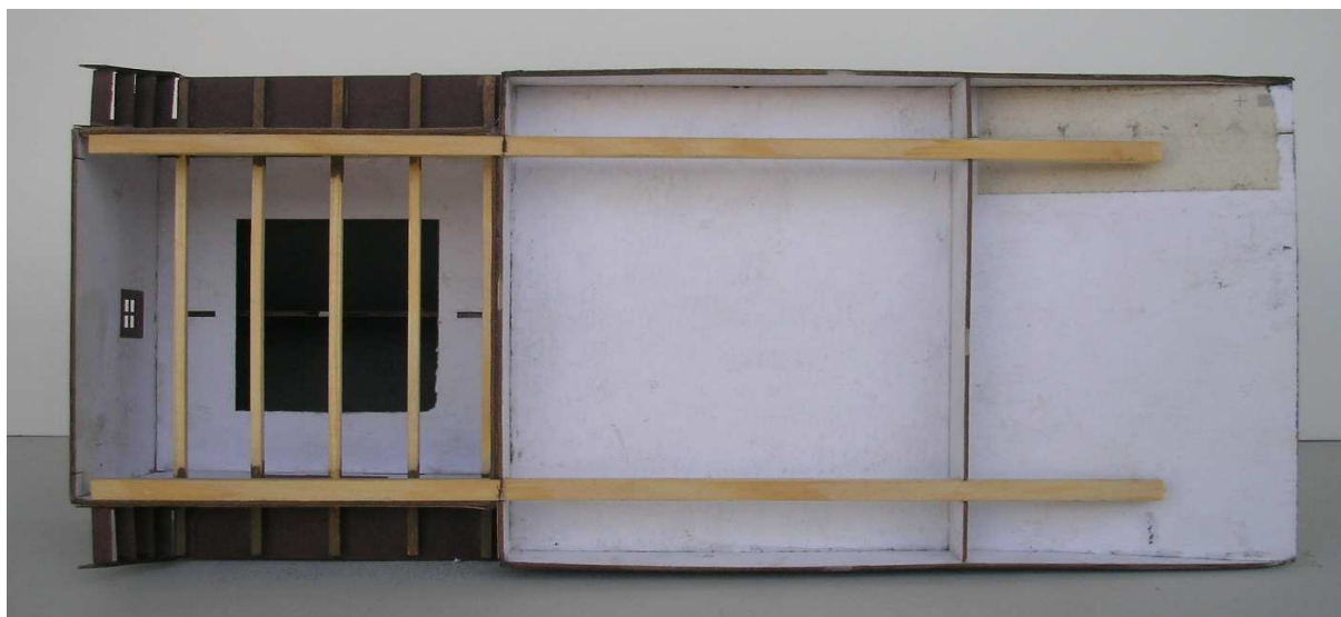
Obr.: možnost vyztužení rampy a budovy skladu smrkovými nosníky

K budově skladu přilepte rampu, při tom si můžete vypomoci smrkovými nosníky, které lze provléknout prořezy v rampě a v budově a které zajistí souběžnost sestavy. Rampu z horní plochy přesypte šedým prachem imitujícím štěrk, v rozích u budovy náletovou zelení.