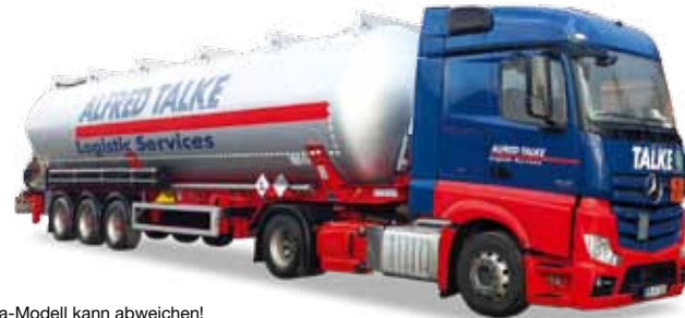
Vorbildfoto: Herpa-Modell kann abweichen! Prototype image: Herpa model may vary!

305716 Mercedes-Benz Actros Streamscape 2.3 ADR-Silo-Sattelzug / Mercedes-Benz Actros Streamscape 2.3 silo semitrailer „Alfred Talke“ Formneuheit! Mit einem neuen Gefahrgut-Siloflügel präsentiert Herpa ein neues Modell der Spedition Alfred Talke aus Hürth. Der Silokörper wurde entsprechend dem Vorbild neu gestaltet, ebenso erhielt das Modell heckseitig einen neuen Auslaufschutz. / New type! Herpa presents a new model of the forwarder Alfred Talke from Hürth. This time a new silo trailer for dangerous goods. The silo body was designed according to the original and also features the new leak protection in the rear.