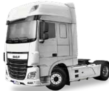
Vorbildfoto: Herpa-Modell kann abweichen! Prototype image: Herpa model may vary!