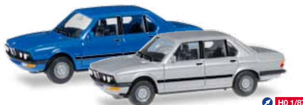
028653 038652 BMW 528i (E28), hellblau / light blue BMW 528i (E28), silber metallic / silver metallic Happy Birthday. Der intern als E28 bezeichnete 5er BMW feiert im Jahr 2016 seinen 35. Geburtstag. Als besondere Widmung legt Herpa den Klassiker aus München in verbesserter Form neu auf. / Happy Birthday. The 5series BMW, internally referred to as E28, celebrated its 35 th anniversary in 2016. As special dedication Herpa once again releases the classic from Munich as an improved version.