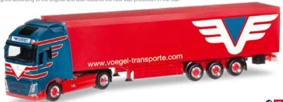
Vorbildfoto: Herpa-Modell kann abweichen! Prototype image: Herpa model may vary!

305921 Volvo FH Gl. XL Schubboden-Sattelzug / Volvo FH Gl. XL walking floor semitrailer „Vögel“ (A) Die in Bludesch ansässige Spedition Vögel setzt auch den aktuellen Volvo FH vor einem Schubboden-Auflieger ein. Das Modell wird mit dem auffälligen Design mehrfarbig bedruckt. / The forwarder Vögel from Bludesch also operates the current Volvo FH pulling a walking floor trailer. The model with the striking design features multi-colored prints.