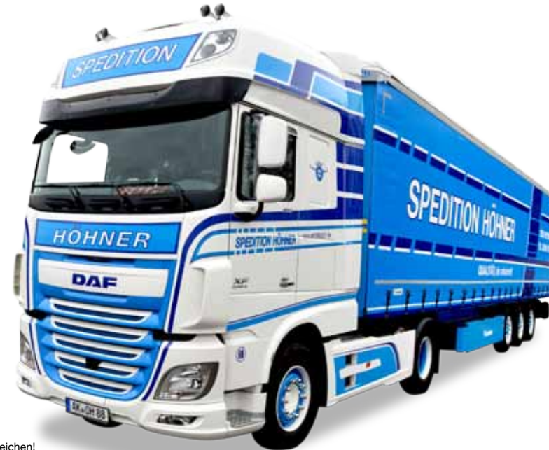
Vorbildfoto: Herpa-Modell kann abweichen! Prototype image: Herpa model may vary!