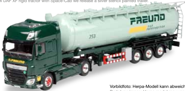
Vorbildfoto: Herpa-Modell kann abweichen! Prototype image: Herpa model may vary!

305983 DAF XF 105 Euro 6 SSC Silo-Sattelzug / DAF XF 105 Euro 6 SSC silo semitrailer „Freund“ Formneuheit! Seit jeher sind die Fahrzeuge der Spedition Freund aus Frechen auf der Autobahn als Augenweide zu bezeichnen, die Modelle von Herpa sind mit ihren Chromfelgen und der ansprechenden Bedruckung ebenso sehr begehrt. / New type! The vehicles of the forwarder Freund from Frechen are always a feast for the eyes on the autobahn. The Herpa models with the chromed rims and the appealing prints are just as coveted.