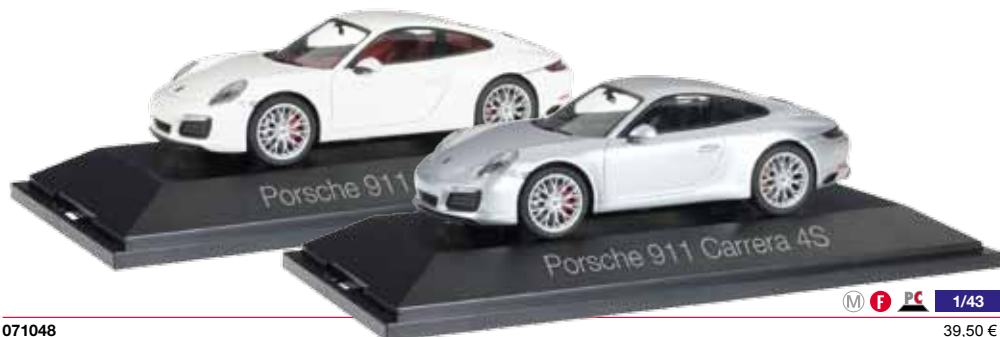
071048 071055 Porsche 911 Carrera 4S Coupé, weiß / white Porsche 911 Carrera 4S Coupé, rhodiumsilbermetallic / rhodium silver metallic

New type! The fleet of 1/43 scale Porsche models at Herpa continues to grow. With the new releases for May / June 2016 we now release the Porsche 911 Carrera 4 in its S variant with modified exhaust system. The appealing Targa version is also released in its standard and Targa S variants.