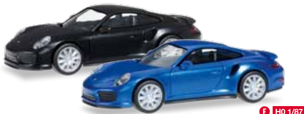
028615 038614 Porsche 911 Turbo, schwarz / black Porsche 911 Turbo, saphierblau metallic / saphier blue metallic Formneuheit! Die Top-Variante des Porsche-Programms, der 911 Turbo, erweitert ab Juni 2016 bei Herpa das Sortiment der PKW-Modelle der Baugröße 1:87. Mit modernem Heckspoiler wird die filigran gearbeitete Miniatur ausgeliefert. / New type! The top variant of the Porsche program, the 911 Turbo, enhances the Herpa car model range in the 1/87 scale from June 2016. The filigree miniature model is delivered with modern rear spoiler.