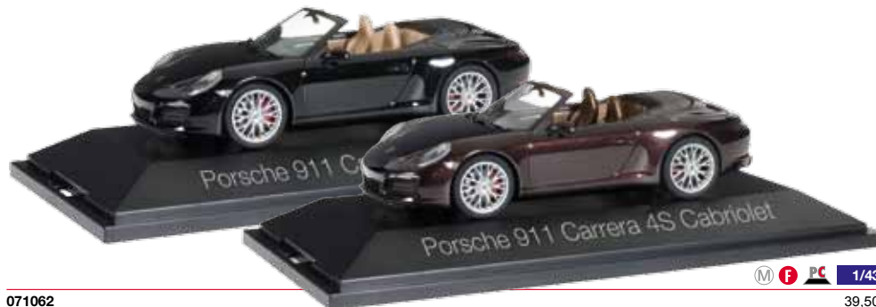
071062 071079 Porsche 911 Carrera 4S Cabriolet, schwarz / black Porsche 911 Carrera 4S Cabriolet, mahagonimetallic / mahagoni metallic