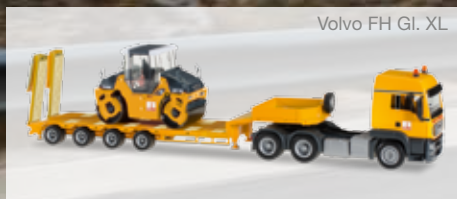
Volvo FH Gl. XL