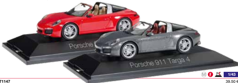
071147 071154 Porsche 911 Targa 4, indischrot / indisch red Porsche 911 Targa 4, achatgrau metallic / achatgrey metallic