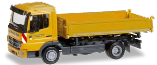
ab März lieferbar! delivery in March! HO 1/87 304399 Mercedes-Benz Atego Dreiseitenkipper / Mercedes-Benz Atego 3-way discharge skip „Leonhard Weiss“ 24,50 €

ab März lieferbar! delivery in March! HO 1/87 32,50 €