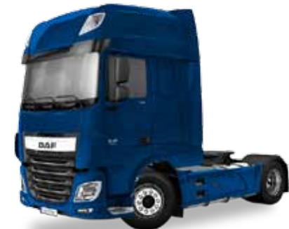
Vorbildfoto: Herpa-Modell kann abweichen! Prototype image: Herpa model may vary! ab März lieferbar! delivery in March! HO 1/87 305976 14,50 € DAF XF 105 Euro 6 SC Zugmaschine, enzianblau / DAF XF 105 Euro 6 SSC rigid tractor, enzian blue