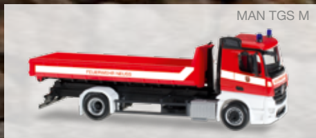
MAN TGS M