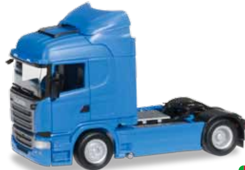
302838-002 14,50 € Scania R Streamline Highline Zugmaschine, blau / Scania R Streamline Highline rigid tractor, blue