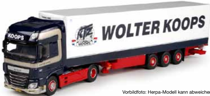
Vorbildfoto: Herpa-Modell kann abweichen! Prototype image: Herpa model may vary!

305907 DAF XF 105 Euro 6 SSC Kühlkoffer-Sattelzug / DAF XF 105 Euro 6 SSC refrigerated box semitrailer „Wolter Koops“ Formneuheit! Mit den Neuheiten Mai/Juni 2016 erscheint die völlig neu entwickelte DAF XF 105 Zugmaschine im Design der niederländischen Spedition Wolter Koops, die in 15 Ländern aktiv ist. / New type! With the new releases May/June 2016 we release the newly developed DAF XF 105 rigid tractor featuring the design of the Dutch forwarder Wolter Koops, who is active in 15 countries.