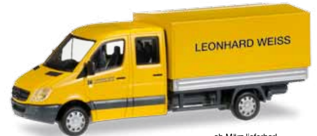
ab März lieferbar! delivery in March! HO 1/87 092326 Mercedes-Benz Sprinter '13 Doppelkabine mit Pritsche / Mercedes-Benz Sprinter '13 double cabin with platform „Leonhard Weiss“ 19,50 €

Formneuheit! Noch vor den Neuheiten Mai/Juni 2016 wird Herpa die neue DAF XF 105 Euro 6 Zugmaschine mit dem Super Space Cab Fahrerhaus in den drei Farben Pastellorange, Schwarz und Enzianblau an den Fachhandel ausliefern.