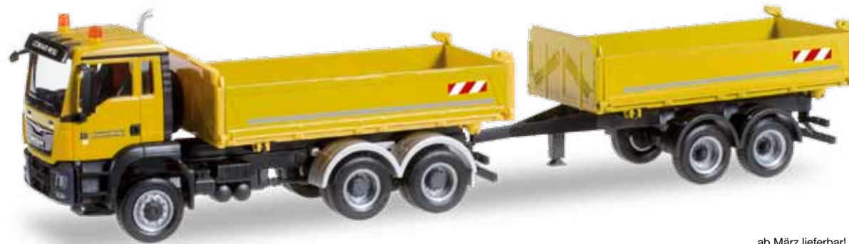
304405 MAN TGS M Baukipper-Hängerzug / MAN TGS M dump trailer „Leonhard Weiss“

Leonhard Weiss with headquarters in Satteldorf, Baden-Württemberg, has been in the business since 1900. Herpa will henceforth release models of the construction company in irregular intervals. An MAN TGS M tandem tipper trailer, a Mercedes-Benz Atego three-way tipper as well as a Mercedes-Benz Sprinter with double-cab and curtain canvas kick off the series. Additional vehicles to follow.