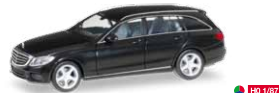
038393-003 Mercedes-Benz C-Klasse T-Modell Elegance, schwarz metallic Mercedes-Benz C-Klasse T-Modell Elegance, black metallic