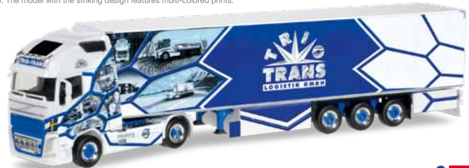
Vorbildfoto: Herpa-Modell kann abweichen! Prototype image: Herpa model may vary!

305938 Volvo FH Gl. XL Kühlkoffer-Sattelzug / Volvo FH Gl. XL refrigerated box semitrailer „Trio-Trans History“ Die Geschichte der Spedition hat sich Trio-Trans jetzt von Airbrush-Künstler Wolfgang Zeh auf einem Truck verewigen lassen. Wie im Original wird auch das Modell mit Top-Scheinwerfer und Kühlergrill-Scheinwerfer ausgestattet. / Trio-Trans had its company history eternalized on a truck by airbrush artist Wolfgang Zeh. The model also features the top headlights and the radiator grill headlights.