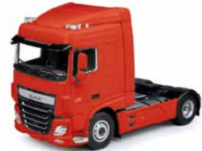
Vorbildfoto: Herpa-Modell kann abweichen! Prototype image: Herpa model may vary!