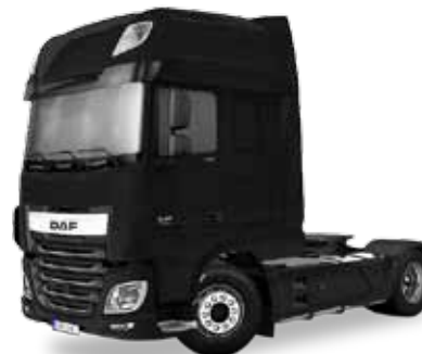
Vorbildfoto: Herpa-Modell kann abweichen! Prototype image: Herpa model may vary! ab März lieferbar! delivery in March! HO 1/87 305969 14,50 € DAF XF 105 Euro 6 SSC Zugmaschine, schwarz / DAF XF 105 Euro 6 SSC rigid tractor, black