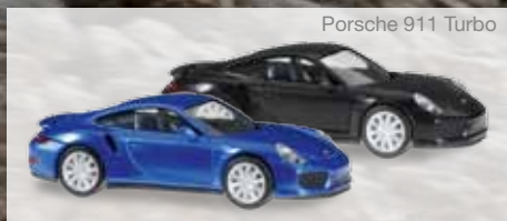
Porsche 911 Turbo