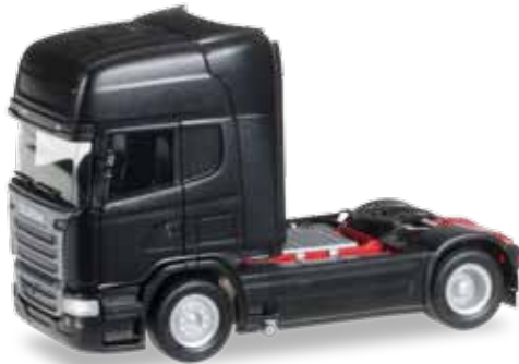
302647-003 14,50 € Scania R Streamline Topline Zugmaschine, schwarz / Scania R Streamline Topline rigid tractor, black