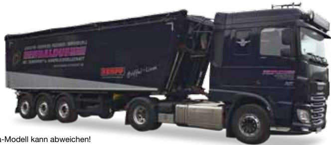
Vorbildfoto: Herpa-Modell kann abweichen! Prototype image: Herpa model may vary!

305815 DAF XF 105 Euro 6 SC Stöffelliner-Sattelzug / DAF XF 105 Euro 6 SC Stöffelliner truck semitrailer „Baldus“ Formneuheit! Das auf den Transport von Schüttgütern spezialisierte Unternehmen Baldus hat in Zusammenarbeit mit Kempf den Stöffelliner-Auflieger konzipiert. Mit der neuen DAF XF Zugmaschine mit Space-Cab Fahrerhaus erscheint der silber schablonenlackierte Auflieger als Herpa Miniaturmodell. / New type! Baldus, specialized in transporting bulk goods, has designed the Stöffelliner trailer in cooperation with Kempf. With the new DAF XF rigid tractor with Space-Cab we release a silver stencil painted trailer.