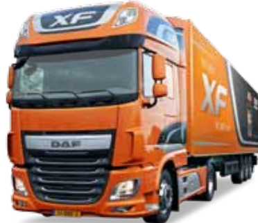
Vorbildfoto: Herpa-Modell kann abweichen! Prototype image: Herpa model may vary!