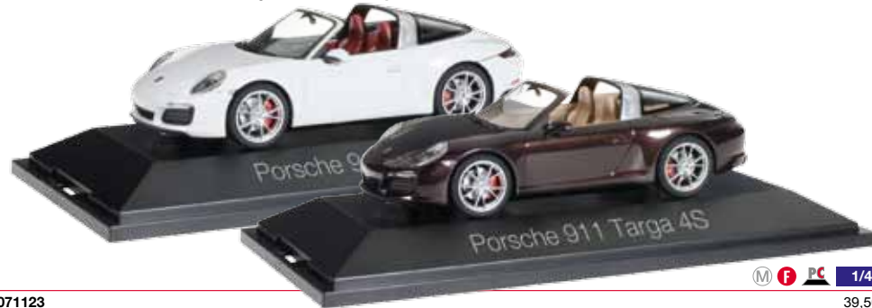
071123 071130 Porsche 911 Targa 4S, weiß / white Porsche 911 Targa 4S, mahagonimetallic / mahagoni metallic