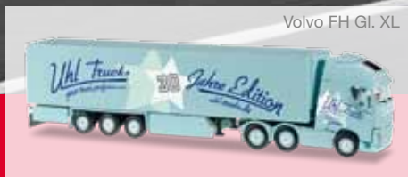
Volvo FH Gl. XL