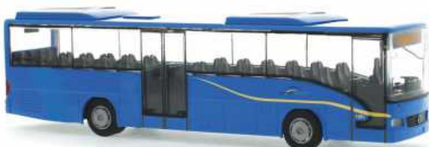
MERCEDES-BENZ Integro „Trentino Transporti, Trento“ 63260 | 1:87 | BV | IT | PG 40