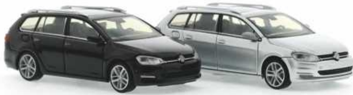
VOLKSWAGEN Golf 7 Variant Deep Black, ohne Schiebedach | 21840 | FN | PG 16 Reflexsilber, mit Schiebedach | 21841 | FN | PG 16