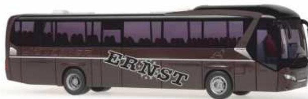
NEOPLAN Jetliner „Ernst Reisen“ 69602 | 1:87 | BV | D | PG 45