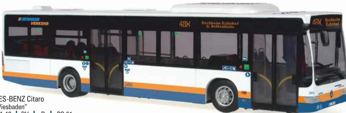
MERCEDES-BENZ Citaro „ESWE, Wiesbaden“ 14233 | 1:43 | BV | D | PG 61