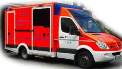
WIETMARSCHER MB Sprinter Design-RTW „Feuerwehr Solingen“ 72001 | 1:87 | FN | D | PG 28