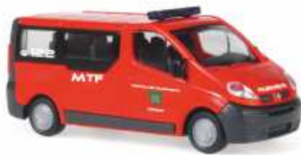
RENAULT Trafic „FFW Kienegg“ 51380 | 1:87 | BV | AT | PG 22