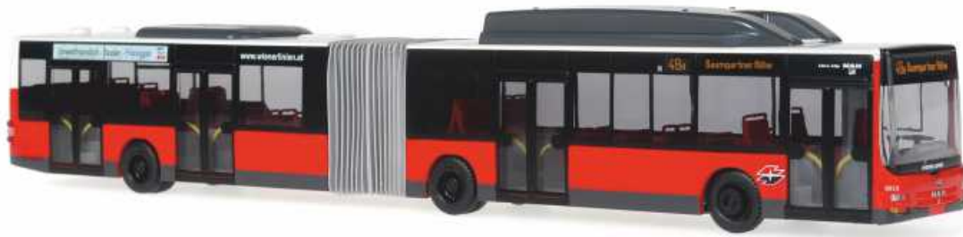
MAN Lion's City G „Wiener Linien, Wien“ 67279 | 1:87 | BV | AT | PG 49