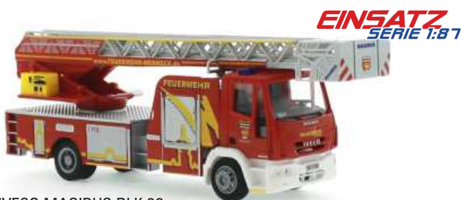
IVECO MAGIRUS DLK 32 „Feuerwehr Werneck“ 68541 | 1:87 | BV | D | BOX | PG 46