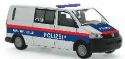
VOLKSWAGEN T5 Halbbus „Polizei - ADR-Kontrolle“ 51873 | 1:87 | BV | AT | PG 25