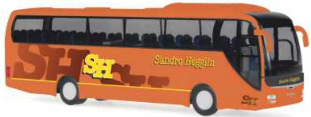
MAN Lion's Coach „Sandro Hegglin“ 64334 | 1:87 | BV | CH | PG 45