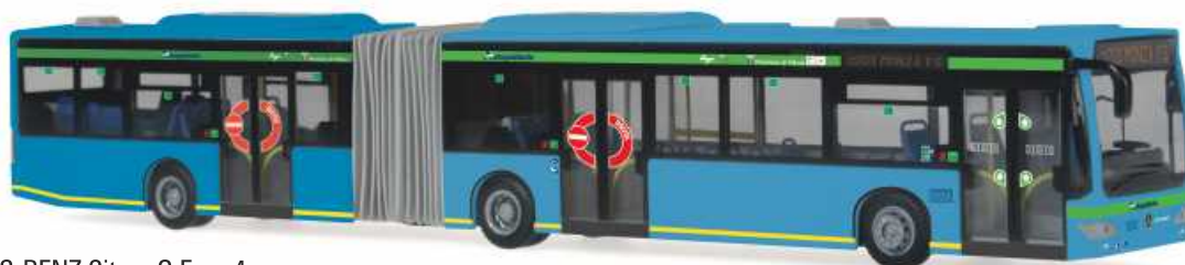
MERCEDES-BENZ Citaro G Euro 4 „TPL Brianza, Brianza“ 67065 | 1:87 | BV | IT | PG 50