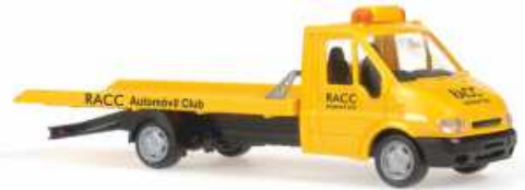
FORD Transit Mod. 2000 Abschleppwagen „RACC Automovil Club“ 31352 | 1:87 | BV | ES | PG 14