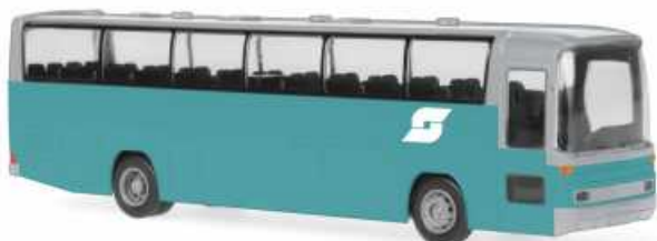
MERCEDES-BENZ O 303 „ÖBB, Wien“ 60293 | 1:87 | BV | AT | PG 40