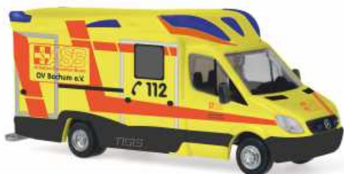
Ambulanz Mobile Tigis Ergo „ASB - OV Bochum e.V.“ 68619 | 1:87 | BV | D | PG 28