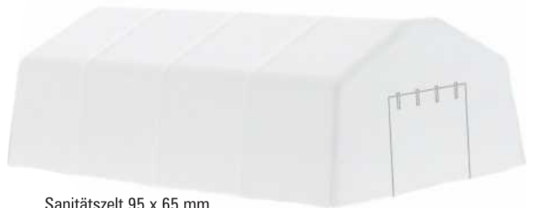
Sanitätszelt 95 x 65 mm 70260 | 1:87 | FN | PG 5