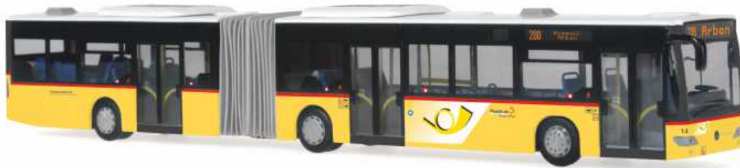
MERCEDES-BENZ Citaro G Euro 4 „Die Post - Arbon“ 68818 | 1:87 | BV | CH | PG 49