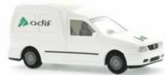
VOLKSWAGEN Caddy Kasten „Adif“ 50858 | 1:87 | BV | ES | PG 13