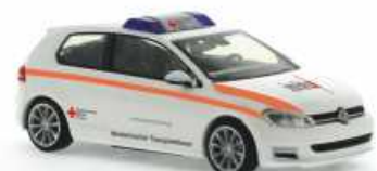
VOLKSWAGEN Golf 7 „BRK, Würzburg“ 53200 | 1:87 | BV | D | PG 25