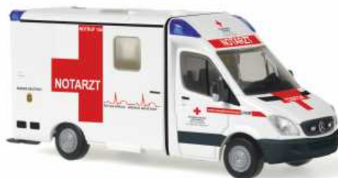
STROBEL MB Sprinter RTW „ÖRK - Wiener Neustadt“ 61765 | 1:87 | BV | AT | PG 28