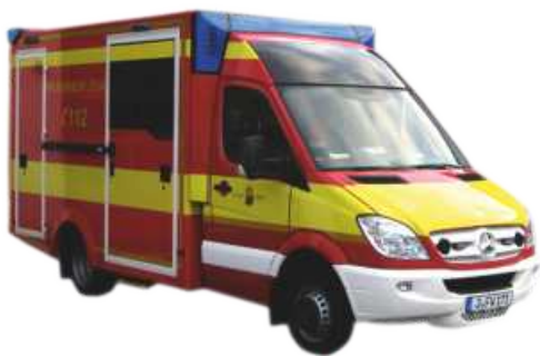
WIETMARSCHER MB Sprinter Design-RTW „Feuerwehr Jena“ 72000 | 1:87 | FN | D | PG 28