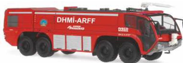
IVECO-MAGIRUS Dragon X8 „Devlet Hava Meydanlari Isletmesi“ 68354 | 1:87 | BV | TR | PG 52