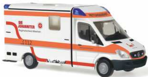
STROBEL MB Sprinter RTW „Die Johanniter - RV Mittelrhein, Koblenz“ 61764 | 1:87 | BV | D | PG 28