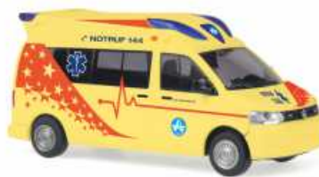
VOLKSWAGEN T5 GP Hornis Baltic „Air Zermatt“ 51872 | 1:87 | BV | CH | PG 26