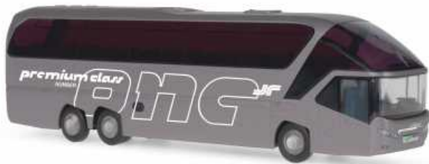
NEOPLAN Starliner 2 „albus - premium class, Wien“ 66761 | 1:87 | BV | AT | PG 45