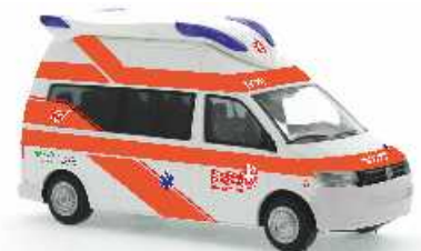
VOLKSWAGEN T5 GP Hornis Blue „Weißes Kreuz, Naturns“ 52696 | 1:87 | BV | IT | PG 26