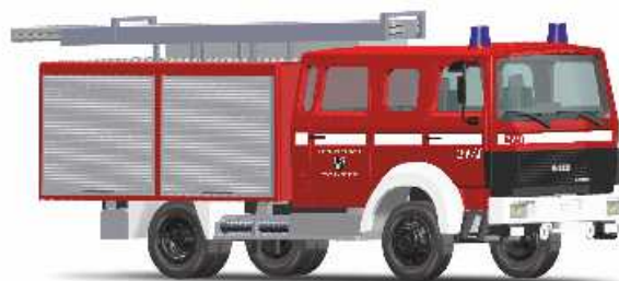
IVECO MAGIRUS MK TLF16 „Feuerwehr Baidersdorf“ 71009 | 1:87 | BV | D | PG 43