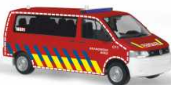
VOLKSWAGEN T5 GP Bus „Brandweer, Bree“ 52625 | 1:87 | BV | NL | PG 25