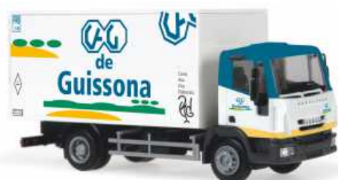
IVECO Eurocargo Mod. 2010 „CAG de Guissona“ 60956 | 1:87 | BV | ES | PG 24