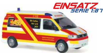
VOLKSWAGEN T5 GP Bus „ASB Worms“ 52688 | 1:87 | BV | D | | PG 27