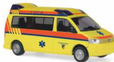
VOLKSWAGEN T5 GP Hornis M „Krankentransport Ost/West, Leipzig“ 52695 | 1:87 | BV | D | PG 25