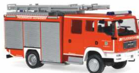
SCHLINGMANN MAN TGM HLF 20/16 „Feuerwehr Hofbieber-Mitte“ 68229 | 1:87 | BV | D | PG 40