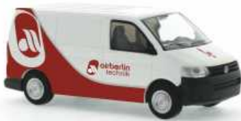
VOLKSWAGEN T5 GP Kasten „Air Berlin Technik“ 31900 | 1:87 | BV | D | PG 23