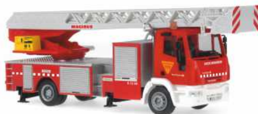
IVECO MAGIRUS DLK 32 „Bombers“ 68538 | 1:87 | BV | ES | PG 45