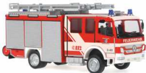
SCHLINGMANN MB Atego TLF „Feuerwehr Bad Hersfeld - Kernstadt“ 68242 | 1:87 | BV | D | PG 40