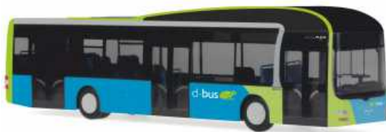
MAN Lion's City Hybrid „D-Bus, San Sebastian“ 67622 | 1:87 | BV | ES | PG 45