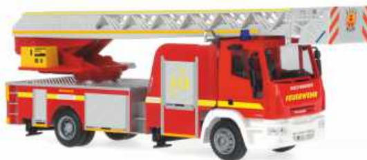
IVECO MAGIRUS DLK 32 „Feuerwehr Warendorf“ 68539 | 1:87 | BV | D | PG 45