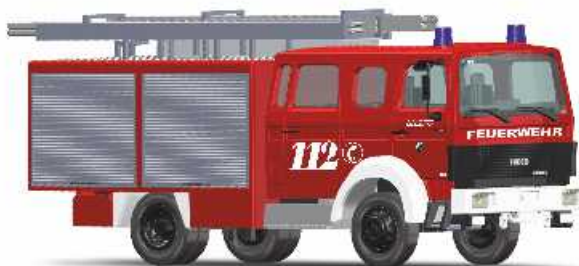
IVECO MAGIRUS MK LF16 „Feuerwehr Künzell - Bachrain“ 71007 | 1:87 | BV | D | PG 43