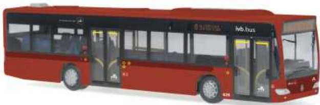
MERCEDES-BENZ Citaro Euro 4 „ivb.bus, Innsbruck“ 66429 | 1:87 | BV | AT | PG 45