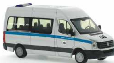
VOLKSWAGEN Crafter Bus „BAG, Köln“ 53109 | 1:87 | BV | D | PG 25