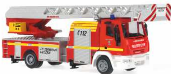
IVECO MAGIRUS DLK 32 „Feuerwehr Uelzen“ 68540 | 1:87 | BV | D | PG 45