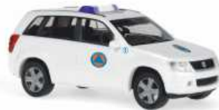
SUZUKI Grand Vitara „Protezione Civile“ 50296 | 1:87 | BV | IT | PG 22