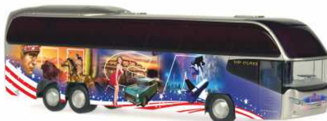
NEOPLAN Cityliner C „World Wide Gruppenreisen“ 63975 | 1:87 | BV | D | PG 45