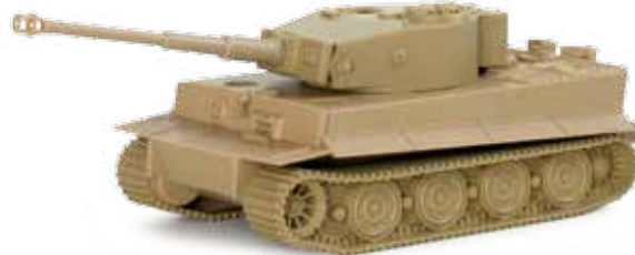
740340 Kampfswagen VI Tiger, späte Version, undekoriert / Tank VI Tiger, late version, undecorated 18,95 €