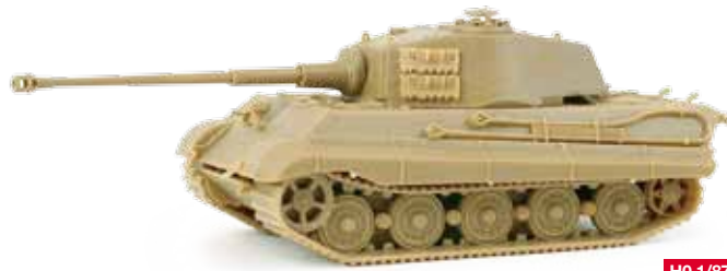
743440 Panzerkampfwagen VI „Königstiger“ Sd. Kfz. 182 mit Henschel Turm, undekoriert Heavy tank Kingtiger VI with Henschel turret, undecorated 18,95 €