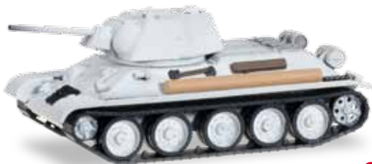
745550 Kampfpanzer T 34 - 76 Leningrad 1943/1944 / Tank T 34 - 76 Leningrad 1943/1944 27,95 €