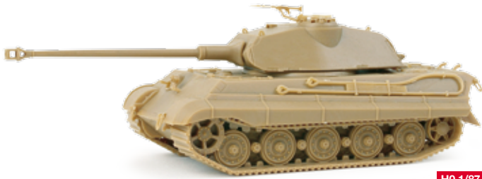
743457 Panzerkampfwagen VI „Königstiger“ Sd. Kfz. 182 mit Porsche Turm, undekoriert Heavy tank Kingtiger with Porsche turret, undecorated 18,95 €