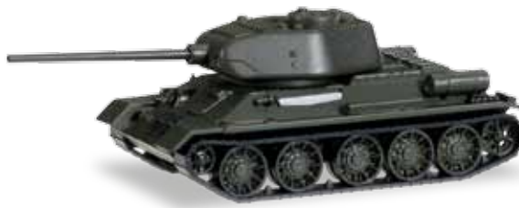
745543 Kampfpanzer T 34 - 85 mit D-5 Kanone / Tank T 34 - 85 mit D-5 Kanone 27,95 €

- Mercedes-Benz and the design of the enclosed product are subject to intellectual property protection owned by Daimler AG. They are used by Herpa Miniaturmodelle GmbH under license. - Marken-, Geschmacksmuster- und Urheberrechte werden benutzt mit der Erlaubnis des Inhabers Volkswagen AG / AUDI AG / AB Volvo. - Brand names, design patents and intellectual property rights have been used with the permission of the owner Volkswagen AG / AUDI AG / AB Volvo. - The BMW logo and the BMW wordmark are trademarks of BMW AG and are used under License.