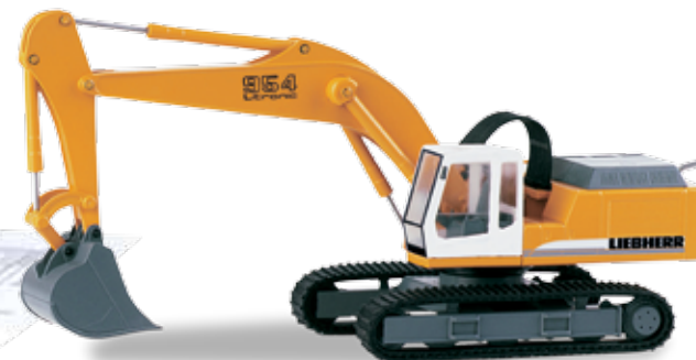
H0 1/87 42,95 € 148931 Liebherr Raupenbagger / Liebherr crawler excavator „R954“