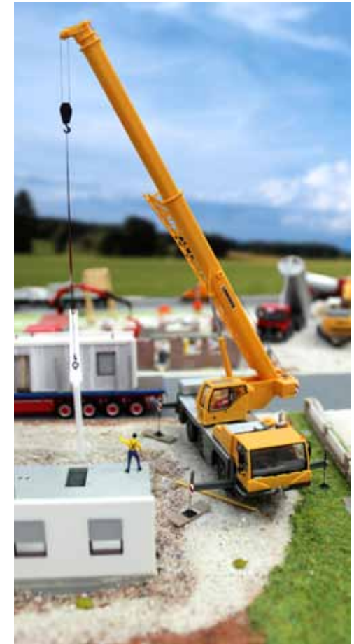
H0 1/87 58,95 € 150231 Liebherr Mobilkran LTM 1045 „Liebherr“ Mehr Informationen / More information: www.herpa.de/?150231

companies like Hochtief or Max Bögl. The small 1/87 scale (H0) world became even more perfect in 2001 when the first construction machine, a Liebherr L580 wheel loader, was released. Since those days, there has been no end of possibilities in creating model construction sites: crawler excavators, rollers, cranes, the most specialized construction vehicles, even a construction trailer or a forklift are available in the Herpa range. In combination, they allow various scenarios to be replicated, ranging from road construction to major construction sites. And here too, you will find father and son gazing transfixed at displays or simply at home in front of the showcase.