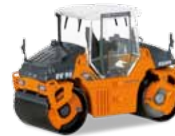
H0 1/87 154291 27,95 € Hamm Tandemwalze DV 90 / Hamm tandem roller DV 90