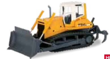
H0 1/87 29,95 € 151689 Liebherr Planierdraupe PR734 Litronic / Liebherr bulldozer PR 734 Litronic

companies like Hochtief or Max Bögl. The small 1/87 scale (H0) world became even more perfect in 2001 when the first construction machine, a Liebherr L580 wheel loader, was released. Since those days, there has been no end of possibilities in creating model construction sites: crawler excavators, rollers, cranes, the most specialized construction vehicles, even a construction trailer or a forklift are available in the Herpa range. In combination, they allow various scenarios to be replicated, ranging from road construction to major construction sites. And here too, you will find father and son gazing transfixed at displays or simply at home in front of the showcase.