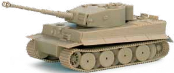
740357 Kampfswagen VI Tiger, mittlere Version, undekoriert / Tank VI Tiger middle Version, undecorated 18,95 €